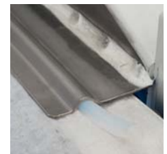
Dichtung seitlich / Lateral seal