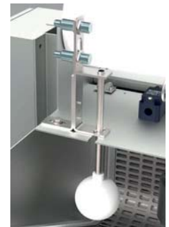
Schwimmerschalter / Float switch