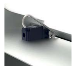
Vliesmangelschalter / Fleece limit switch