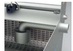
Einlaufverteiler / Inlet distributor