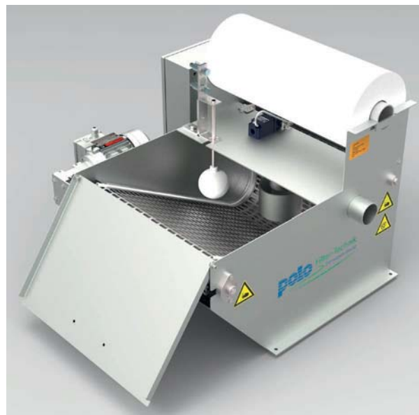
Filtermulde / Filter trough

Die Fotos zeigen teilweise Zusatzausstattungen. Some of the photos show additional equipment.