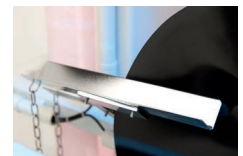
Zwei Abstreifer Two strippers

Die Fotos zeigen teilweise Zusatzausstattungen. / Some of the photos show additional equipment.