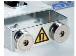
Optional mit Magnetfuß Magnetic base optional