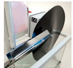
Nahezu wartungsfrei Virtually maintenance-free