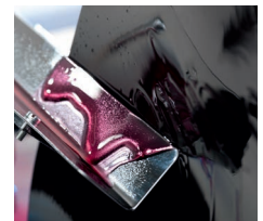
Abstreifung in die Ablaufrinne Stripping in the drain trough