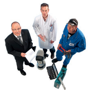
Fragen Sie uns! Please contact us!

Technische Änderungen, die dem Fortschritt dienen, vorbehalten. Subject to technical changes in the interest of progress.